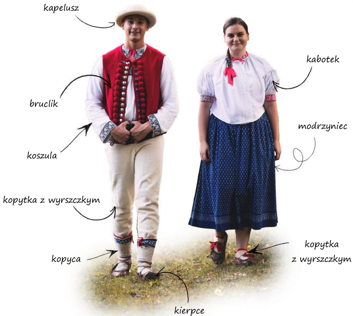
Górale śląscy / Sliezski gorali

Každá oblasť v krajine má svoj kroj – ženský a mužský. Práve vďaka nemu bolo možné voľakedy spoznať, kto odkiaľ pochádza. Goralský kroj je odevom, ktorý bol v minulosti obliekaný ženami i mužmi bývajúcimi v horských oblastiach. Jeho vzhľad závisel od počasia a určenia. Ľudia sa inak obliekali bežný deň a inak pri príležitosti sviatkov.